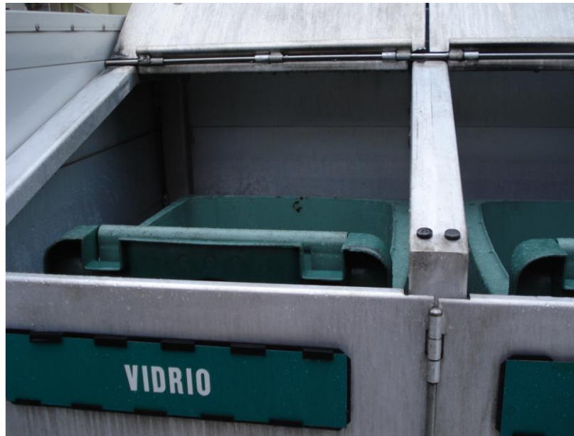
Exemplo de contedores da tipoloxía indicada

Haberá un número de colectores igual á cantidade de residuos indicada no apartado correspondente deste documento e serán de un tamaño acorde có residuo a depositar.