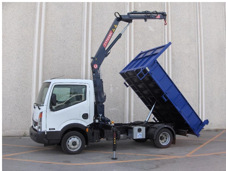
Exemplo de camión da tipoloxía indicada

Po outro lado o punto limpo móbil o formará os colectores de residuos que contarán con: